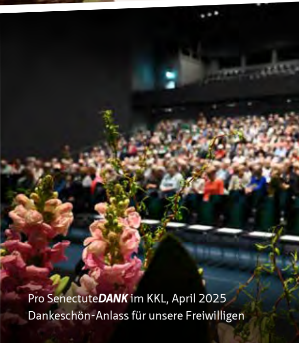
Pro Senectute DANK im KKL, April 2025 Dankeschön-Anlass für unsere Freiwilligen