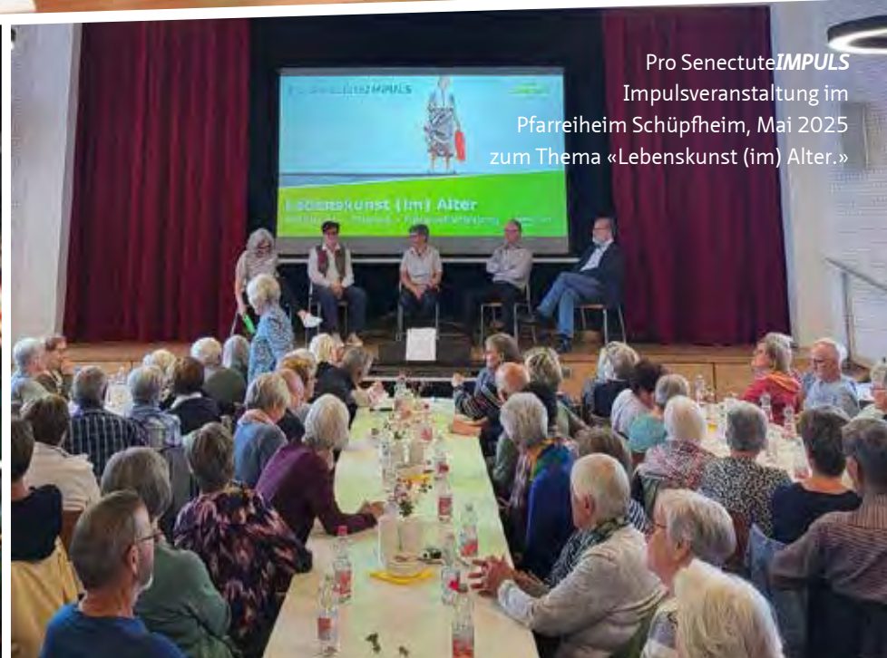
Pro Senectute IMPULS Impulsveranstaltung im Pfarreiheim Schöpfheim, Mai 2025 zum Thema «Lebenskunst (im) Alter.»

«Herzlichen Dank unseren Sponsorinnen und Sponsoren, Freiwilligen, Spendenden sowie Pro Senectute nahestehen- den Personen für das entgegengebrachte Vertrauen!»