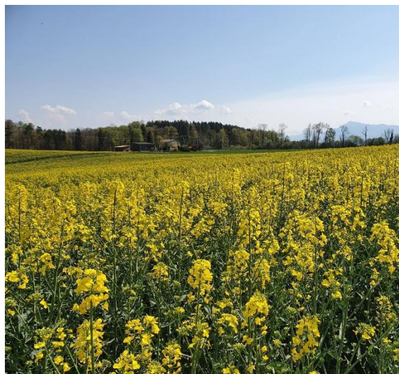
Rapsfelder entlang der schönen Route