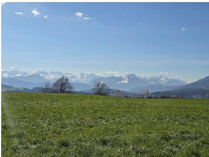
Aussicht auf die Alpenkette