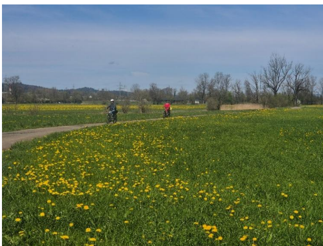
Schlängelnde Wege über Land