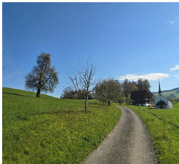
Anfahrt zur Kappelle St. Katharina