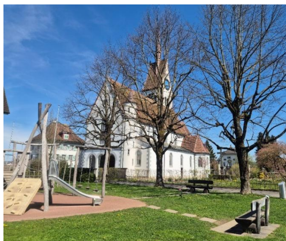
Pic Nic Platz in Merenschwand