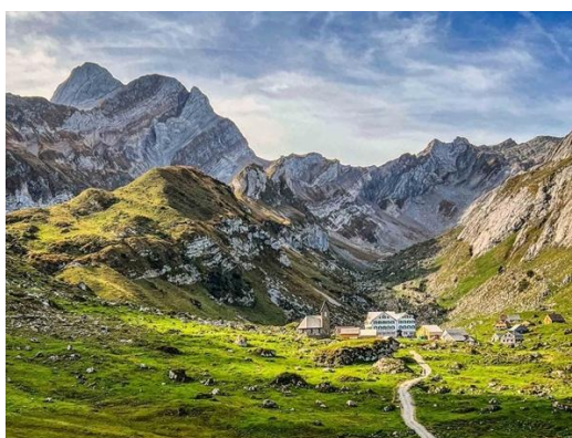
Meglisalp mit Säntis im Hintergrund