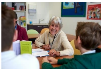
Photo : Le Prix Chronos de Pro Senectute réunit jeunes et moins jeunes grâce à des lectures et des échanges captivants.

Pour plus d'informations sur les livres en lice, les modalités de participation ainsi que les inscriptions au Prix Chronos 2022, consultez le site www.prosenectute.ch/prixchronos-fr