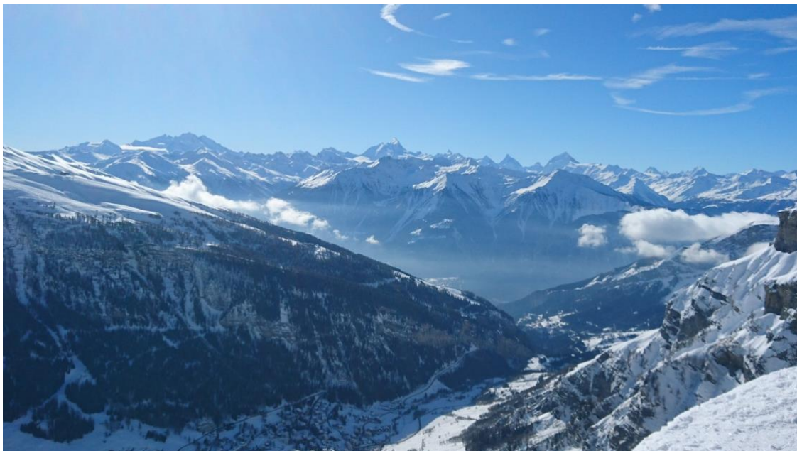
Aussicht vom Gemmipass in die Walliser Hochalpen